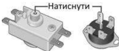
Малюнок 3. Схема розташування кнопки термовимикача

Перераховані вище несправності не є дефектами ЕВН і усуваються споживачем самостійно або за його рахунок.